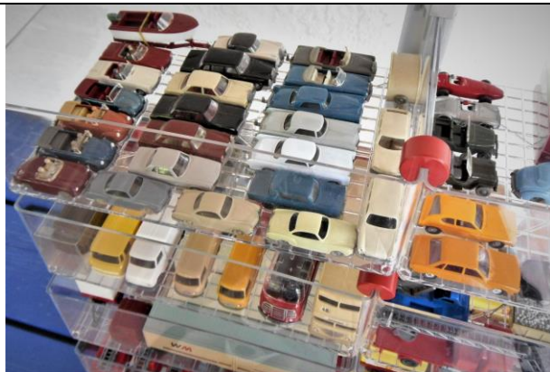
Beispielbilder o., u., rechts = Tresenständer „Lichterfelde 160“